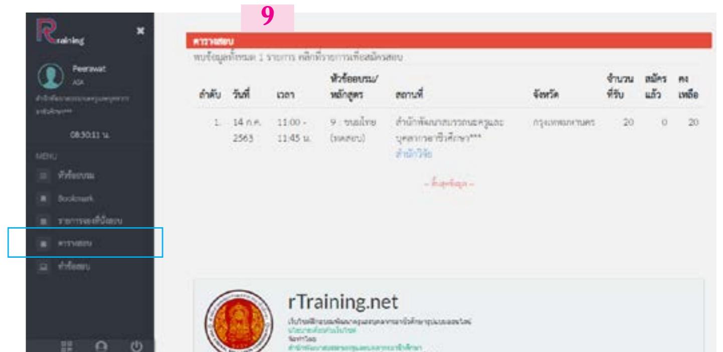
9. เมนู ตารางสอบ จะเปิดให้ท่านที่ต้องการสอบเข้าจองสอบได้

ระบบรายละเอียดต่างๆ ที่เกี่ยวข้องกับการสอบ เมื่อผู้เข้าสอบมีผู้ลงทะเบียนเข้าสอบตามจำนวนระบบจะปิดไม่สามารถขอสอบได้