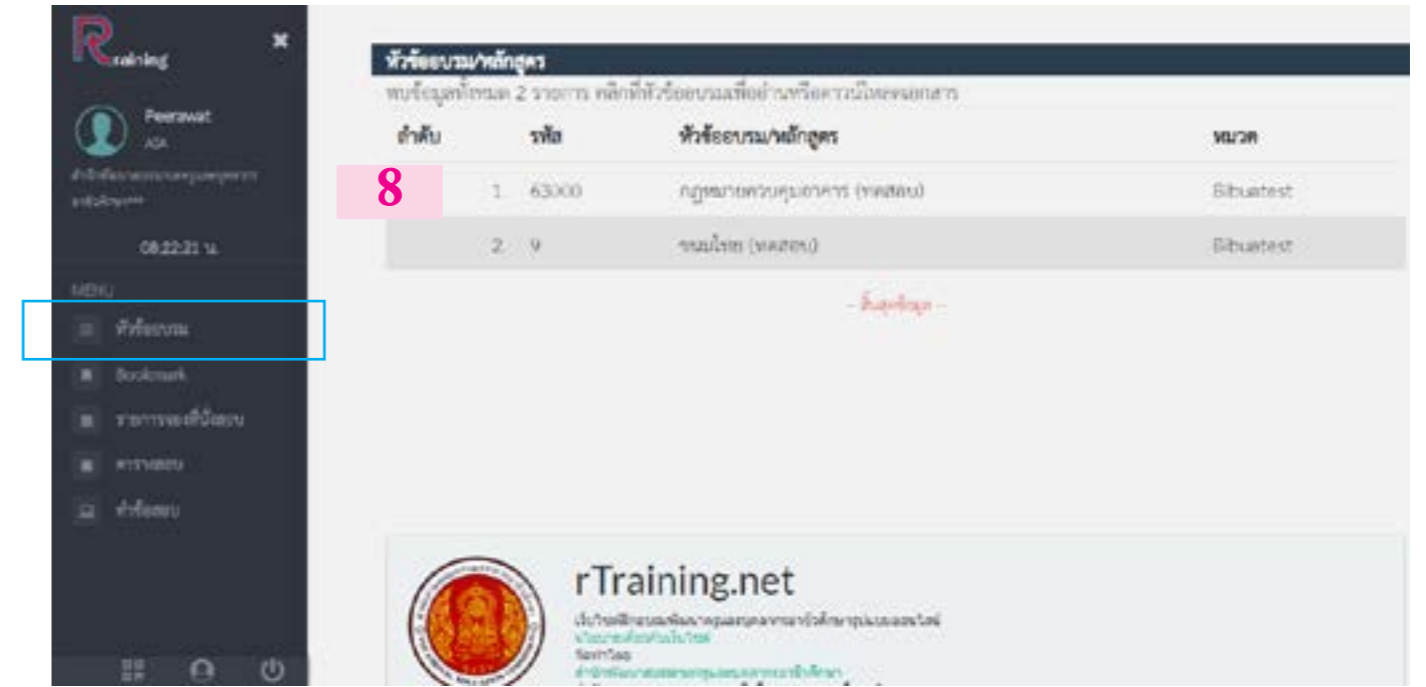
8. หัวข้ออบรมเปิดให้เข้าไปเรียนได้ก่อนทำการทดสอบ